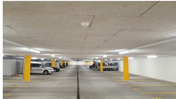
Neu mit LED-Röhren